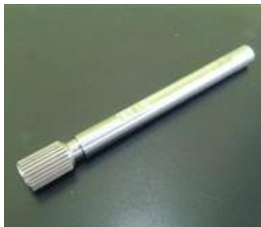
チェックゲージ HPM1, φ11.7 X 130