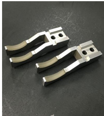
ツメ SKS3, 50 X 190×30