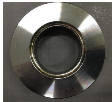
打ち抜きパンチ SKD11, φ100×24