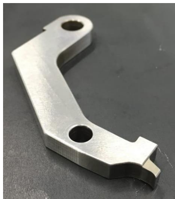
パンチ (部品再生) SKD, 55×65×5

大野精工はツメやカッター等の工場設備で用いる特注工具や、チェックゲージや検査用治具等の部品、パンチやダイをはじめとした金型部品の製作を得意としています。このような部品の調達先でお困りの際はぜひご相談下さい。