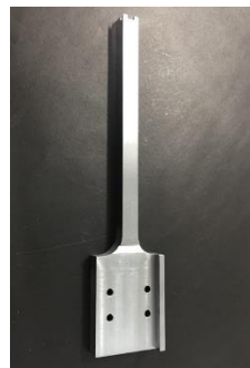
ツメ HPM1, 25×86