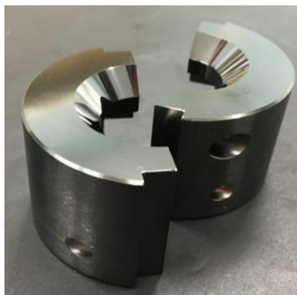
カシメパンチ SKD11, φ50×70