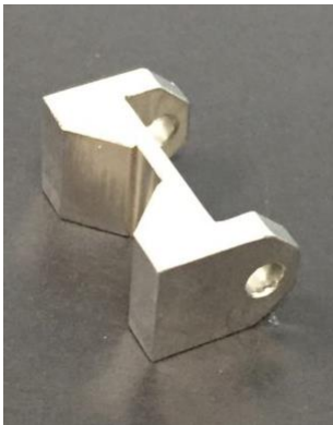
カシメパンチ HPM75, 60×40×25